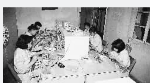
▲1992年,温州的一家电器小作坊。 ▼上海奔腾电器公司现代化生产流水线上,工人在装配饮水器。

30年艰辛的探索改革,30年不懈的攻坚克难,肩负着发展重任,承载着民族梦想,国有经济一定能继续创造出新的辉煌,中国企业一定会跻身于世界强手之林。