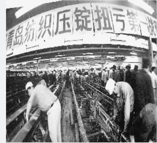
▲1998年,青岛市一家纺织企业压锭。 ▼江苏海安鑫缘纺织企业先进的生产线。