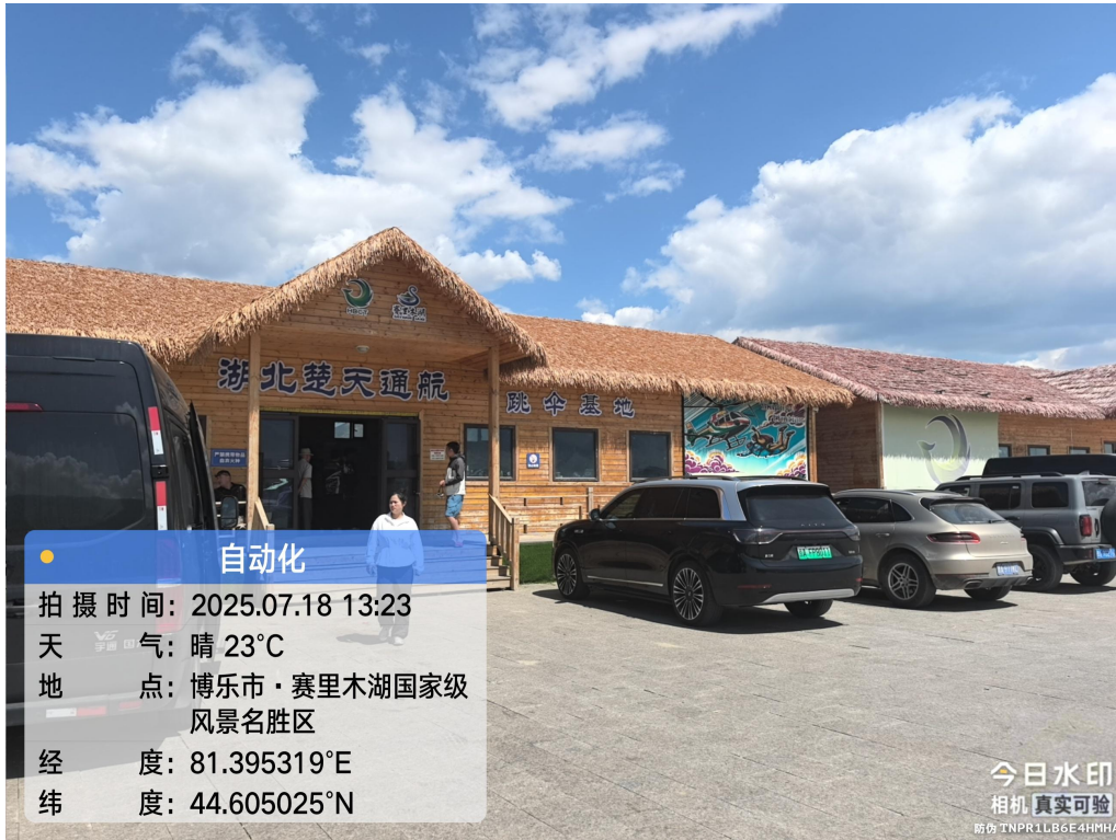
图 1-三台古驿风貌景区旅游服务基础设施-十里长堤附属工程项目