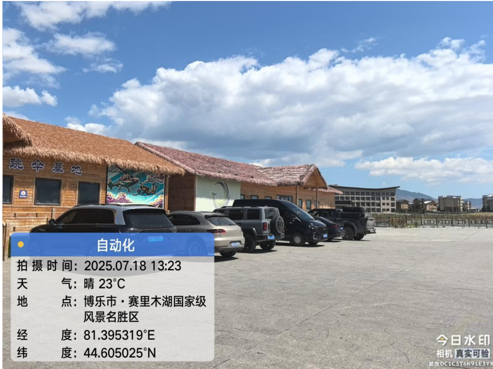
图 3-三台古驿风貌景区旅游服务基础设施-十里长堤附属工程项目