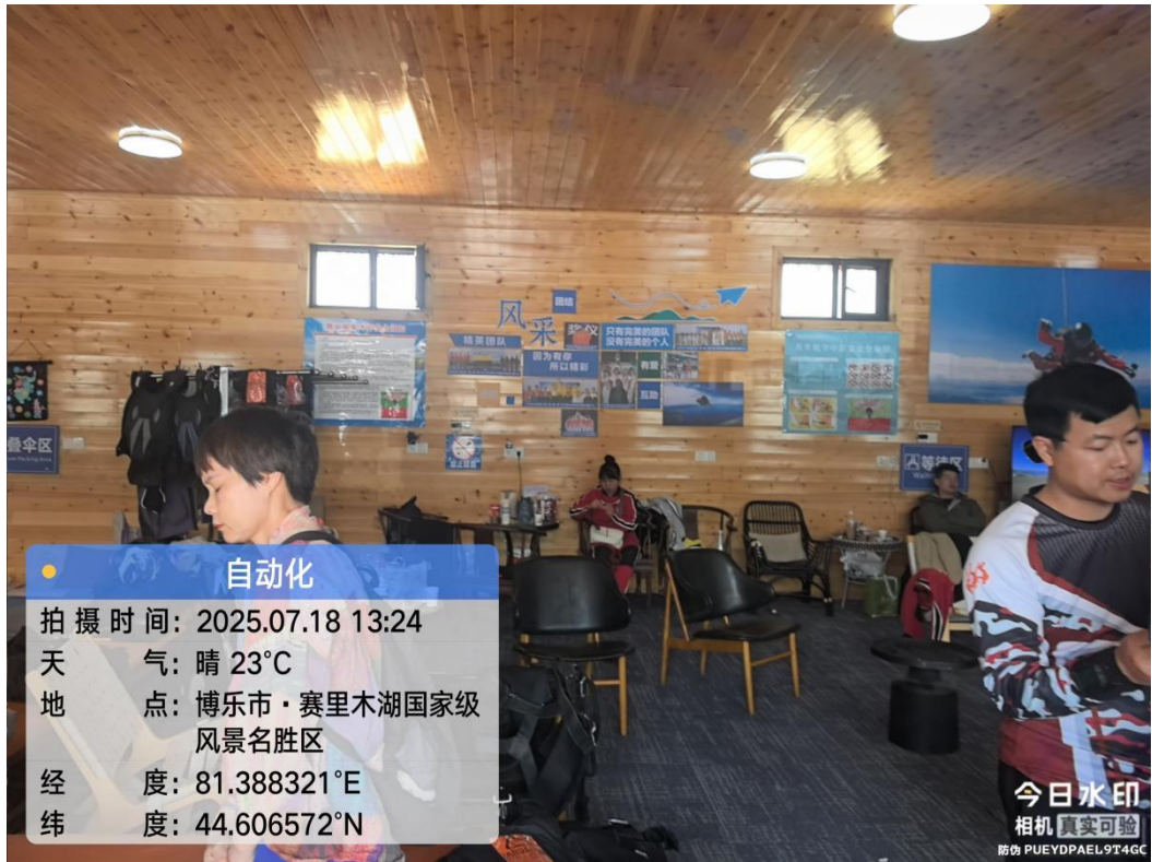
图 7-三台古驿风貌景区旅游服务基础设施-十里长堤附属工程项目内部