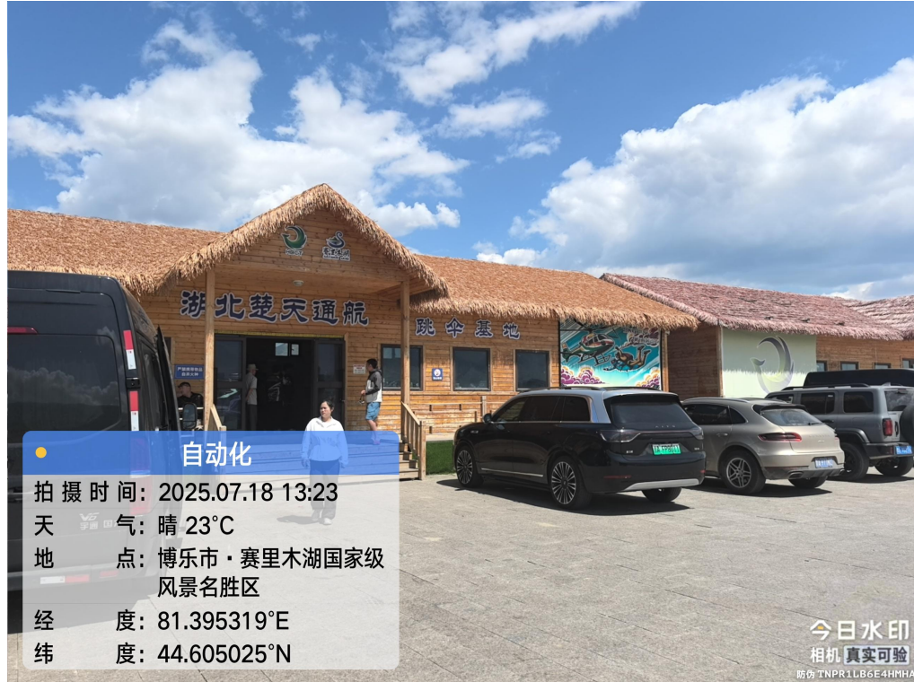
图 2-三台古驿风貌景区旅游服务基础设施-十里长堤附属工程项目