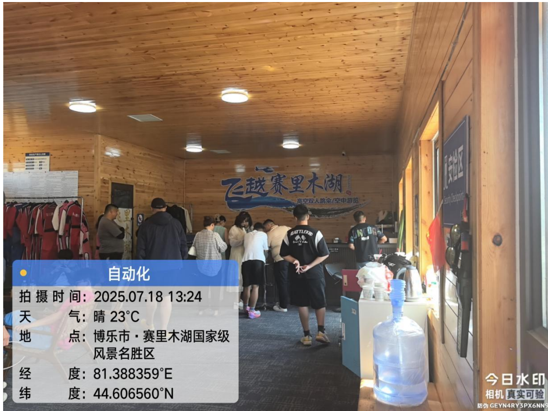
图 5-三台古驿风貌景区旅游服务基础设施-十里长堤附属工程项目内部