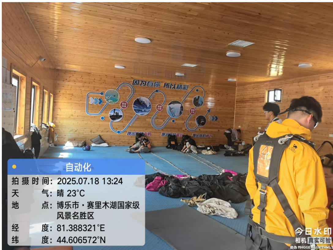
图 6-三台古驿风貌景区旅游服务基础设施-十里长堤附属工程项目内部