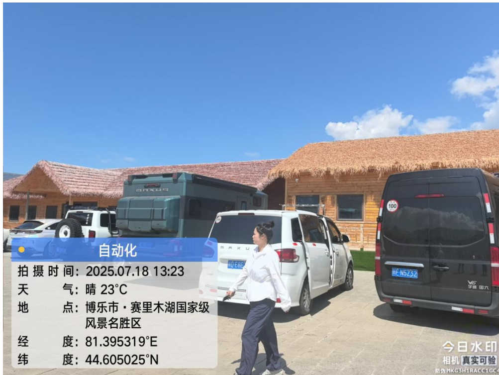
图 4-三台古驿风貌景区旅游服务基础设施-十里长堤附属工程项目